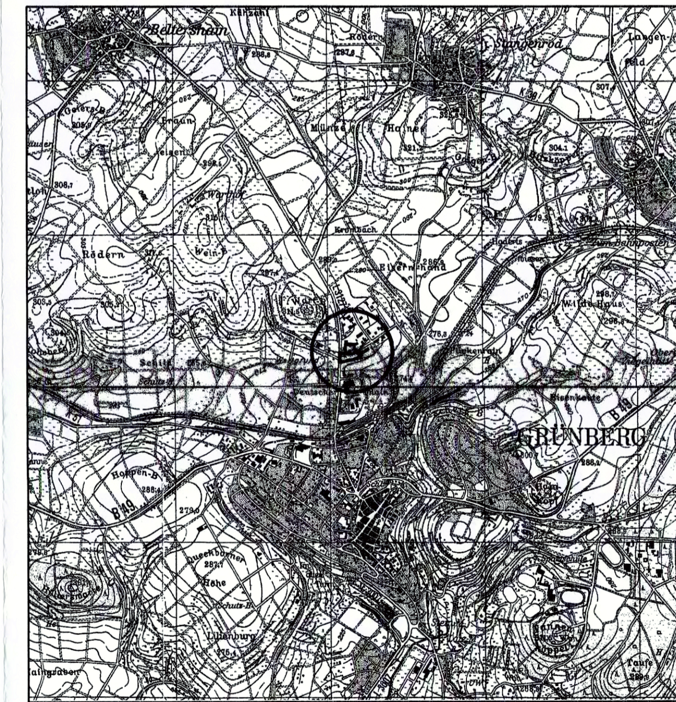
Übersichtskarte (Maßstab 1 : 25.000)