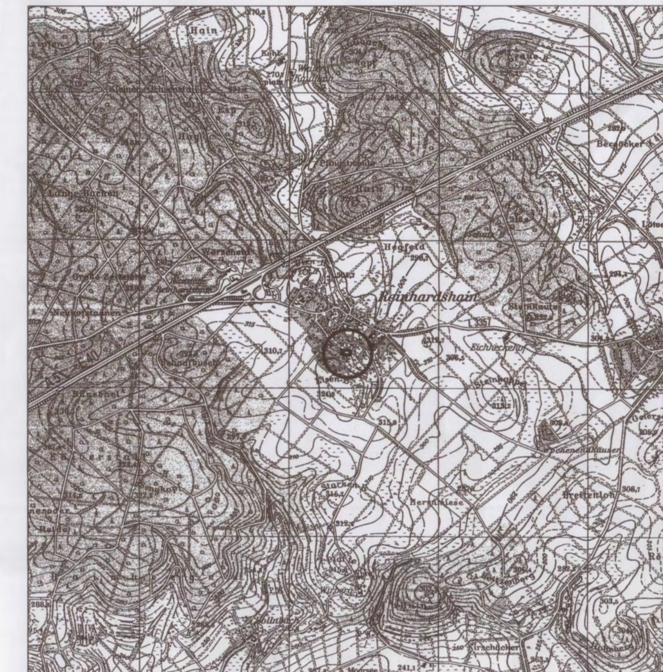
Übersichtskarte (Maßstab 1 : 25.000)