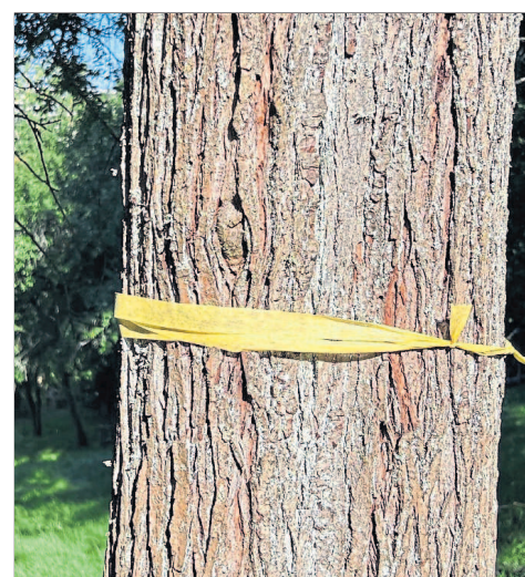
Das gelbe Band signalisiert das hier jeder pflücken darf

Die Aktion »Gelbes Band« läuft mittlerweile in zahlreichen weiteren Kreis-Kommunen. Auch in Lich sind Obstbäume auf Streuobstwiesen, Flurbereinigungsflächen oder an Straßen, deren Eigentümer Äpfel, Birnen oder Zwetschgen nicht selbst ernten und verwerten können, mit einem um den Stamm gebundenen gelben Band markiert.